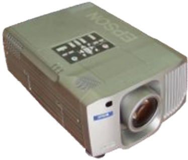
▲マルチメディアプロジェクター▲