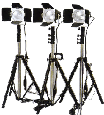
▲ロケーションライト▲