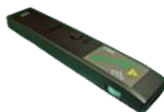
▲レーザーポインター▲