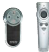
▲プレゼンテーション用マウス▲