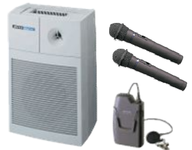
▲ワイヤレスアンプ▲