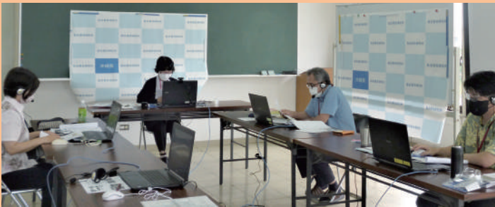
オンラインによる研修会を実施