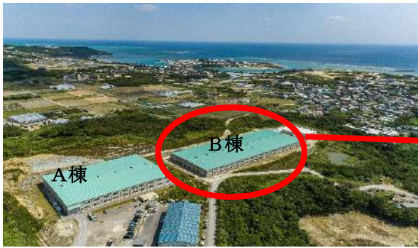
美らグリーン南城（最終処分場）

当該工事は、令和3年度内の完成を予定しておりましたが、昨年5月の降雨により擁壁（パネル）の一部が崩落し工事が停止しております。崩落の原因を究明するためボーリング調査を実施し、その結果を学識者（大学教授）に検証してもらったところ、今回の崩落原因は、降雨による地下水の上昇に伴う地山強さの低下及び間隙水圧が増大したため、変状が発生したことが要因であるとの見解が示されました。それを受け、防衛局へ災害事案として承認をいただき防衛省補助を活用して追加の工事を施工することになりました。令和2年度の繰越予算においてパネルの復旧工事等を実施し、令和3年度の繰越予算で追加工事を行い、本年度内に工事を完了する予定であります。