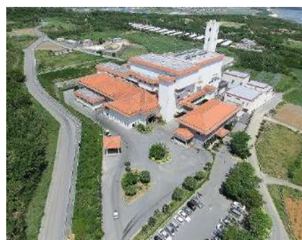
糸豊環境美化センター