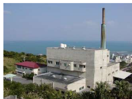
東部環境美化センター