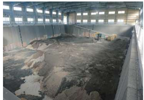
最終処分場埋立地（A棟）

今後も住民の皆様が安心して生活できるように、施設の適正な運営・管理に努めてまいります。