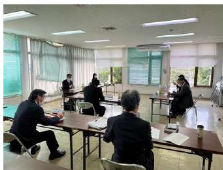
教育委員会の様子