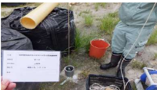
地下水採取（A棟周辺）