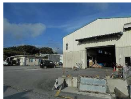
島尻環境美化センター