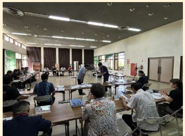
一般廃棄物処理手数料検討委員会(諮問)