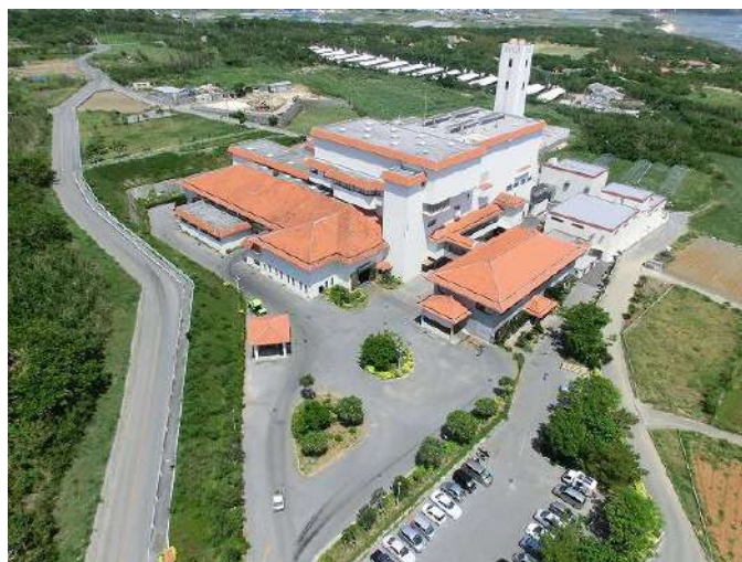
糸豊環境美化センター【糸満市束里】