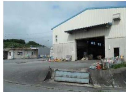
島尻環境美化センター【南城市玉城字奥武】