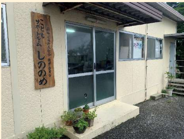
子どもサポートルーム しののめへ名称変更