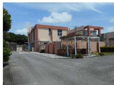
清澄苑【八重瀬町新城】