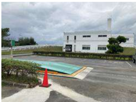
岡波苑【糸満市西崎町】