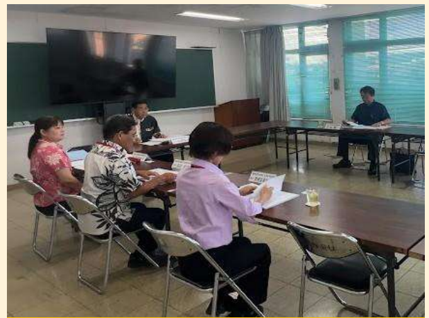
教育事務点検評価員会議