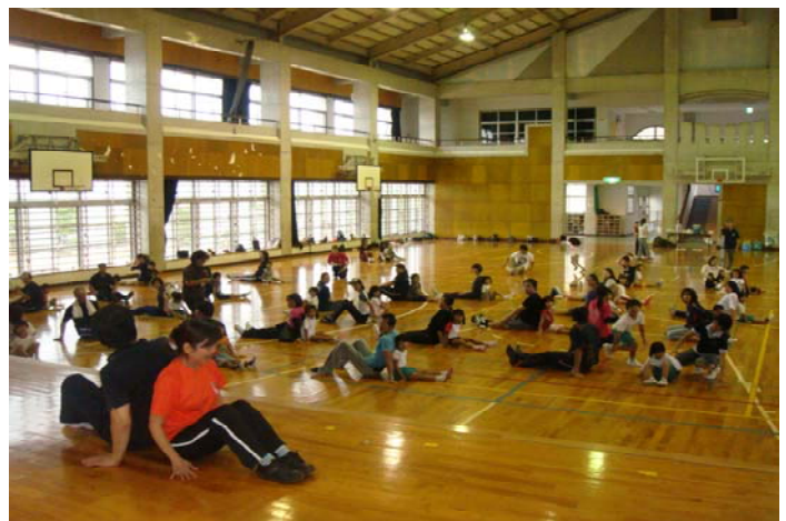
写真2 佐敷幼稚園での親子ふれあい運動フェア