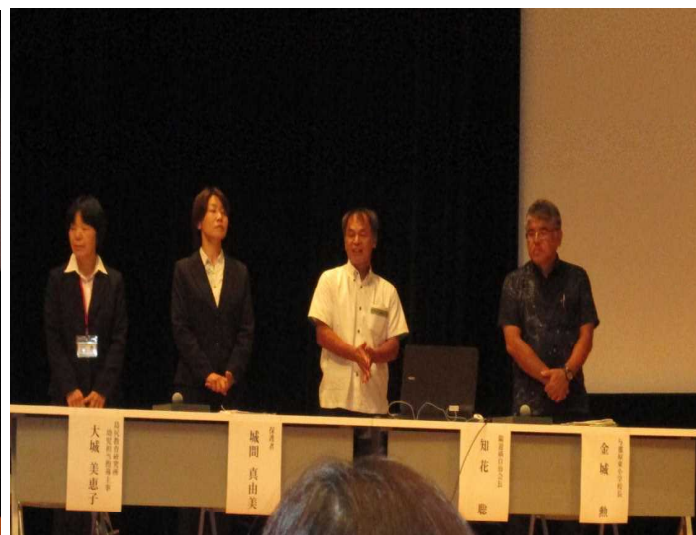
写真4 シンポジストの皆さん