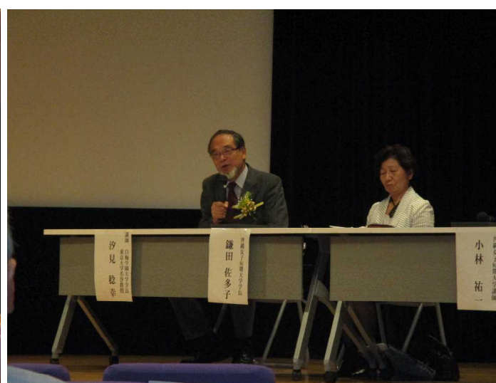
写真6 コメンテーター