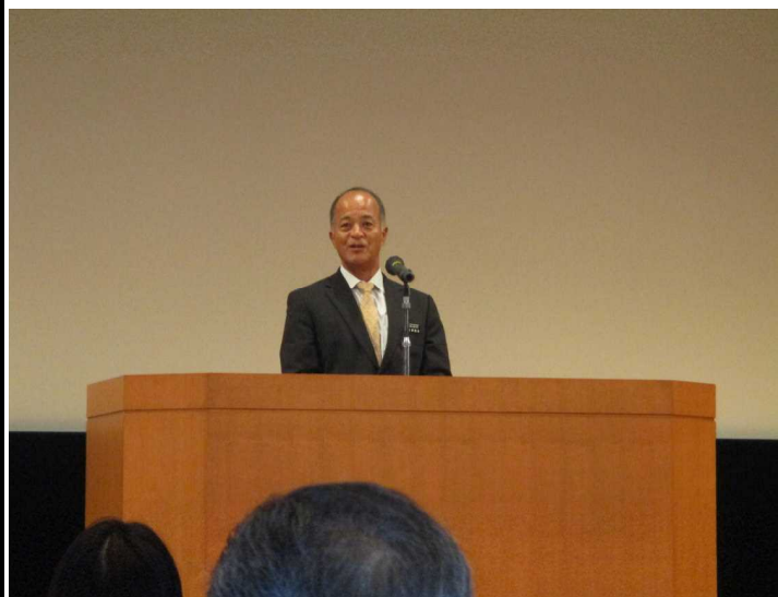
写真1 所長あいさつ