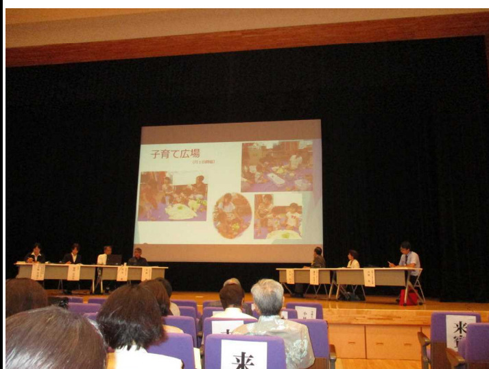
写真5 シンポジウム