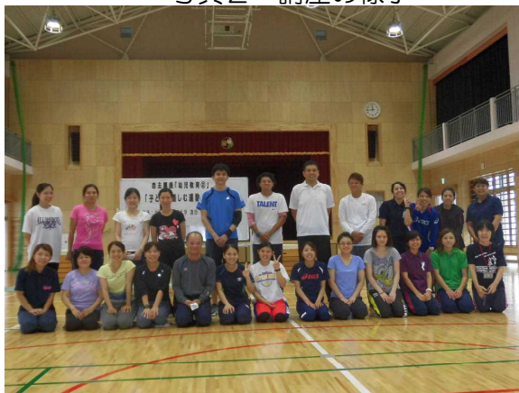
写真3 参加者全員で