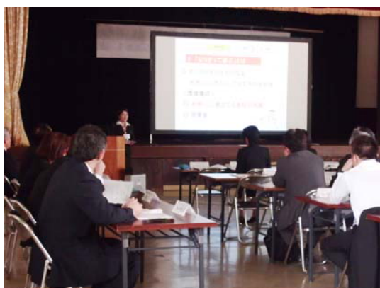
写真1 報告会の様子