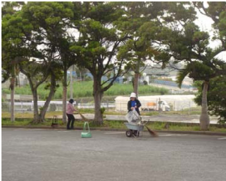
写真1 朝のボランティア清掃

所内研修の中にクラブもあります。「書道」「三線」「琉球舞踊」等を週に1回、2時間程度講師をお招きし、実施してゆきます。