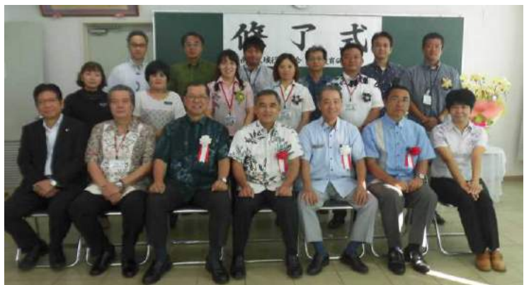
平成30年度「前期修了式」

半年間、研究を深めてきた第48期長期研究員の先生方は、緊張の中にも自信に満ちた表情で、力強く、制限時間いっぱい研究成果を報告しました。この成果を島尻地区の先生方にぜひ活用して頂き、日々の教育の充実に役立てていただければ幸いです。