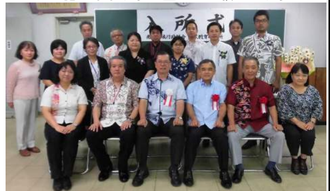
平成30年度後期教育研究員入所式