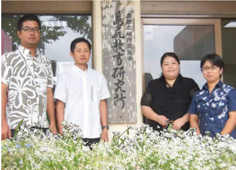
平成30年度後期研究員の皆さん【チーム名:49ers】

10月1日(月)、平成30年度後期教育研究員(第49期)の皆さんが、島尻教育研究所に入所しました。