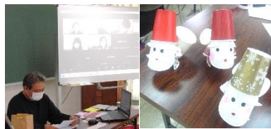
対面・オンライン併用でサンタ制作