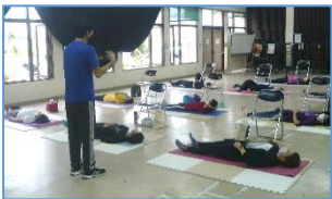
対面講座でリラックス法