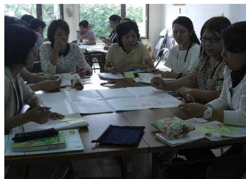
写真2 グループ協議